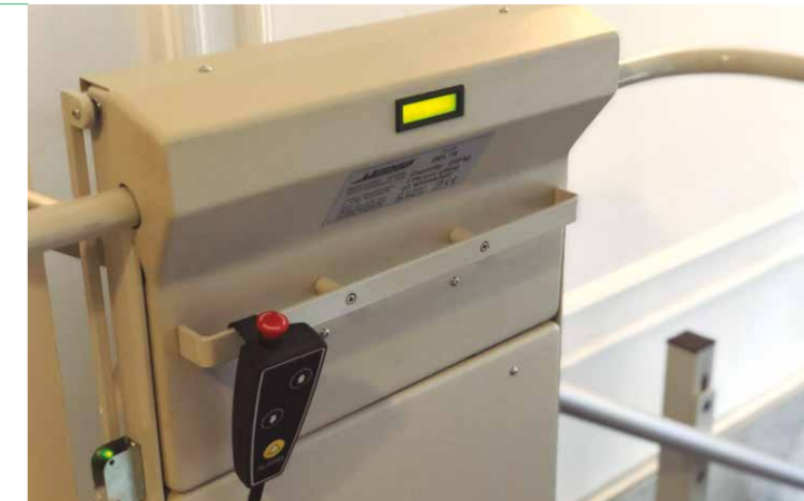
Display con indicador de diagnóstico.

Delta se puede instalar tanto en espacios interiores como en intemperie