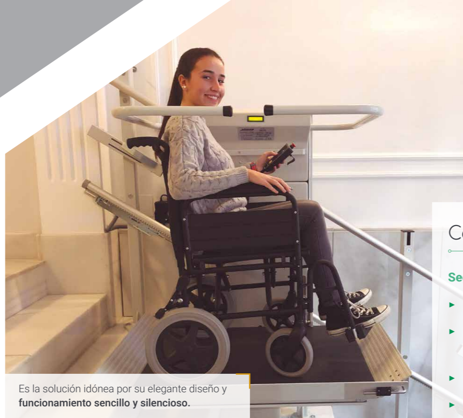
Es la solución idónea por su elegante diseño y funcionamiento sencillo y silencioso .

El espacio necesario para el estacionamiento en la parte inferior puede reducirse al mínimo. Para una longitud de plataforma de 750 mm el espacio necesario requerido delante del primer escalón es de sólo 1225 mm (según pendiente).